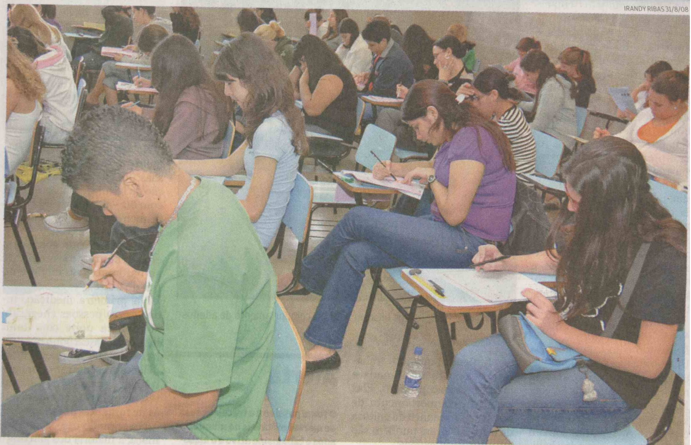
Avaliações que serão aplicadas sábado e domingo terão 90 questões de múltipla escolha, além da redação, elaboradas por professores do COC

participar de simulado do novo exame. As inscrições são gratuitas e podem ser feitas pelo telefone 3228-2100.