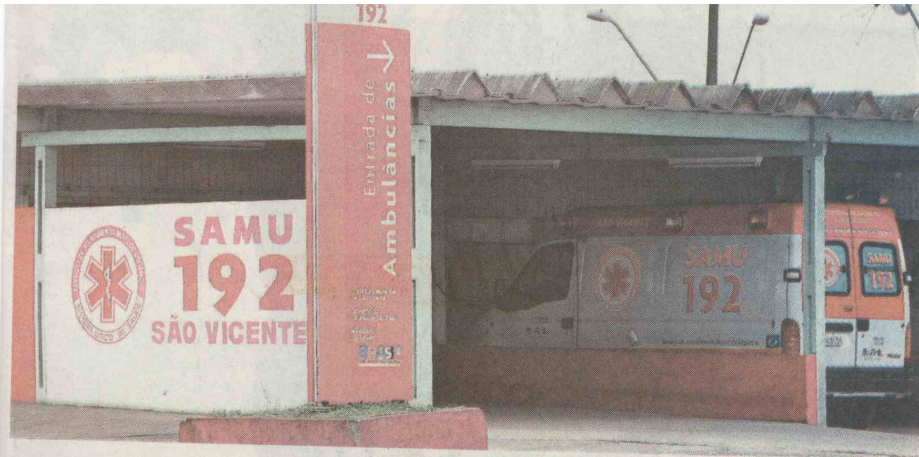
Na região, São Vicente, Cubatão e Itanhaém já são beneficiados pelo programa do Governo Federal